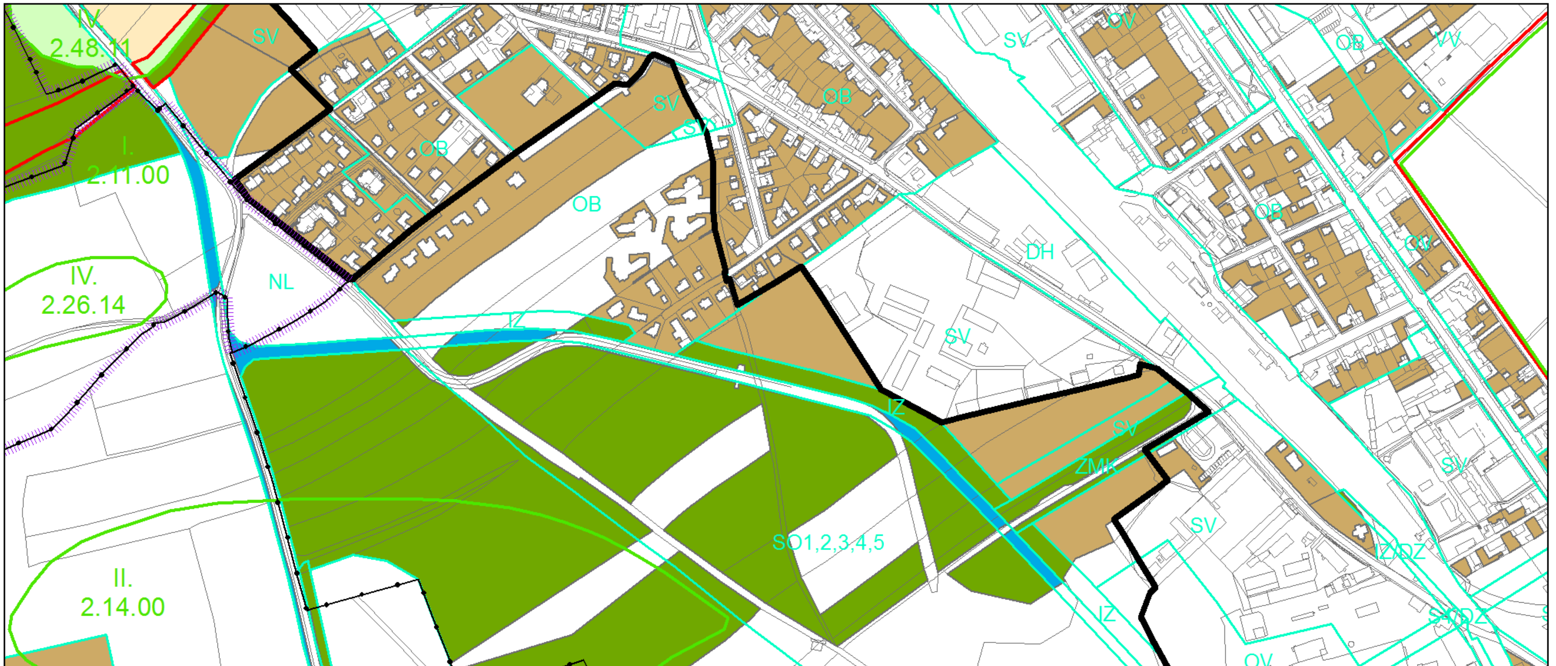
Výkres č. 20 – Vyhodnocení záborů ZPF a PUPFL, platný stav k 1. 1. 2019